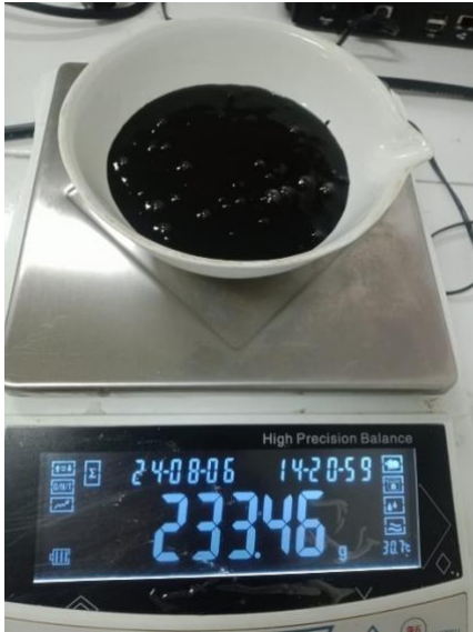
Pembuatan Formulasi Masker Gel Pell-Off